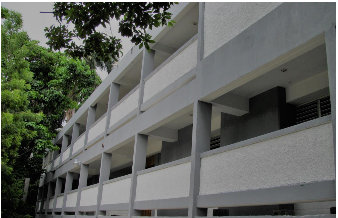
BATIMENT DU PRIMAIRE